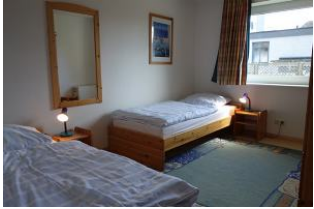
Großes Kinderzimmer mit 2 Einzelbetten