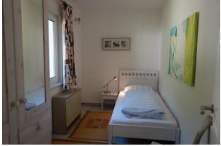
Ein Schlafzimmer mit Einzelbett