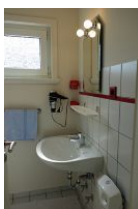
Das Bad mit Handwaschbecken, Spiegel und Toilette (nicht im Bild)