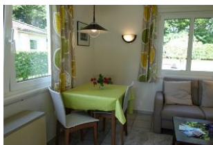
Der Essplatz im Wohnzimmer