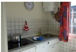
Eine Seite der Küche mit Cerankochfeld und Spüle...