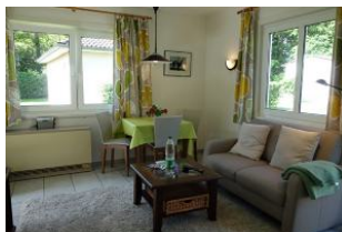
Das Wohnzimmer mit Couch, Essplatz und ...