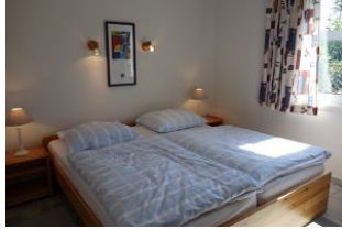
Ein Schlafzimmer mit Doppelbett + Morgensonne