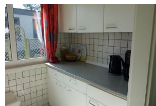
...die andere Seite zum vorbereiten