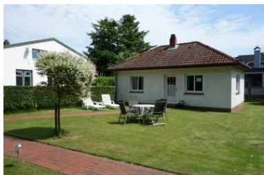
Die Aussenansicht des Bungalow 3 auf der Anlage der Familie Herpich.