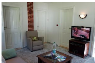
... gemütlichem Sessel und Flachbild TV Gerät