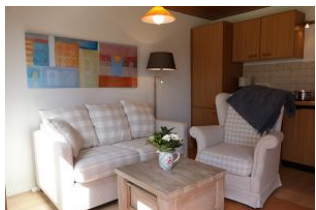
Herrlich gemütlich, Couch und Sessel...

Die Appartements und Bungalows der Familie Herpich inmitten unserer kleinen Stadt erfreuen sich großer Beliebtheit. Ist man doch schnell überall zu Fuß, egal ob Sie zum Strand wollen, zur Promenade, zur Kurmusik, zum Hafen oder auch zum Einkaufen. Auf dem ca. 3000qm großen Grundstück lebt es sich herrlich ruhig, grenzt es doch an keine Strasse. Lediglich das Geklapper der Störche ist zu hören, denn sie wohnen direkt nebenan. Genießen Sie das Naturschauspiel !