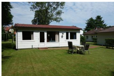
Die Aussenansicht des Bungalow 2 auf dem Grundstück der Fam. Herpich in Wyk