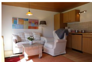
Hier noch einmal: Sitzecke und Küchenzeile