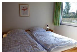
Das Schlafzimmer mit großem Doppelbett.