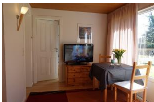
Das TV - Gerät darf natürlich nicht fehlen.