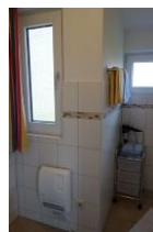
...und noch einmal.