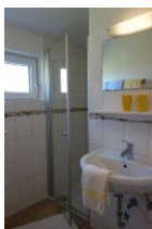
Das frische Bad...