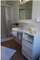
...hier noch einmal von der anderen Seite...