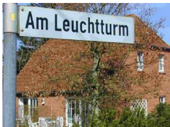
Das Haus Am Leuchtturm 1a

Die Unterkunft verteilt sich über EG und 1.OG.