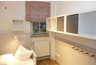
...offenes Regal und Haken für die Kofferinhalte