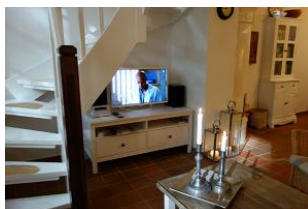
Die Unterhaltungstechnik darf natürlich auch nicht fehlen.