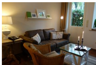
Die gemütliche Couch.