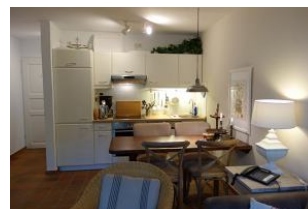
Der Blick in die Küche, im Vordergrund der Essplatz.