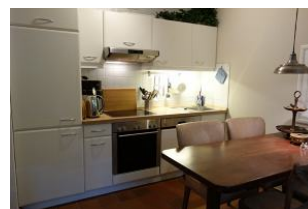
...noch einmal die Küche aus der Nähe