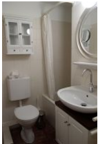
Das Bad im Obergeschoß. Eine Seltenheit: die Sitzbadewanne mit Möglichkeit zum Duschen