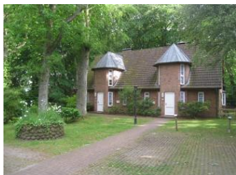
Das Haus Gmelinstr. 19c Die Wohnung befindet sich rechts

Die Unterkunft verteilt sich über EG und 1.OG.