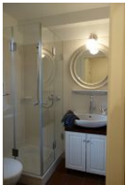
Das Duschbad im Erdgeschoß