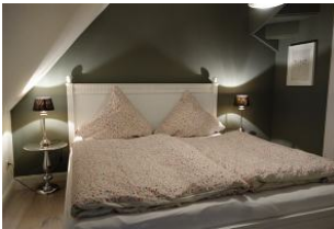
Das Doppelbett im Schlafzimmer.... (180x200m)