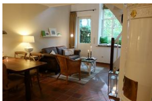
Der Essplatz, im Hintergrund die Sitzcke.