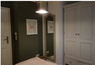
Großer Spiegel und der Kleiderschrank.