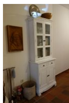
Ein schmaler Vitrinenschrank für "Dies und Das...."