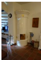
Wohlfühlambiente durch den antiken Schwedenofen.