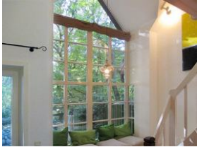
Leseecke mit Ausblick .....