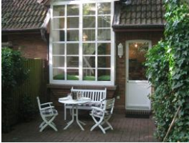
Der gedeckte Tisch lädt zum "Käffchen" im Freien ein.