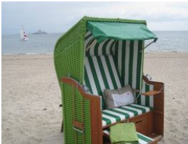
Der Strandkorb am Strand - nur für Sie reserviert. Der Schlüssel befindet sich in Ihrer Wohnung