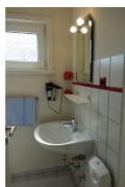
Das Bad mit Handwaschbecken, Spiegel und Toilette (nicht im Bild)