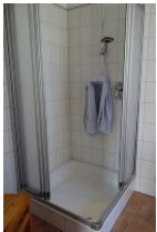
...und die Duschkabine.