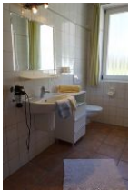
Das Bad: Waschbecken, Toilette, Ablagemöglichkeiten und ein großes Fenster...