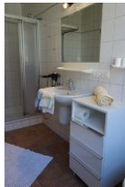
...hier noch einmal von der anderen Seite...