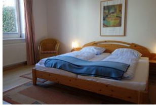
Das großzügige Schlafzimmer mit großem Doppelbett.