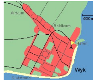
Entfernungen, zirka: zum Bäcker 70 m, zur Einkaufsmöglichkeit 150 m, zum Flugplatz 3,0 km, zum Golfplatz 3,0 km, zum Hafen 300 m, zum Meer 100 m, zum ÖPNV 300 m, zum Badestrand 100 m, zum Ortszentrum 20 m