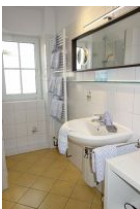
Das Bad mit...