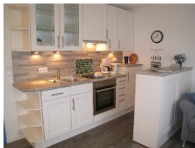
Die Küche mit Backofen.