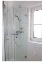
...Dusche, neu mit Glastür.