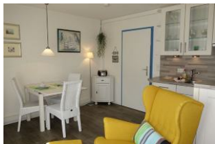
Sessel, Küche, im Hintergrund der Esstisch.