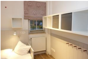
...offenes Regal und Haken für die Kofferinhalte