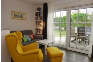
Der gemütliche Sessel mit Blick " ins Grüne....."