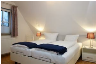
Im OG das Elternschlafzimmer