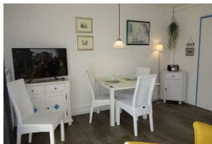
Esstisch und TV Gerät.