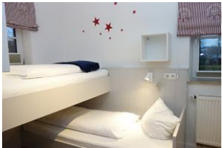
Das Kinderzimmer, 2 Betten über Eck, jeweils 90x200cm