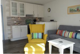
....wer mag sich hier nicht niederlassen ?