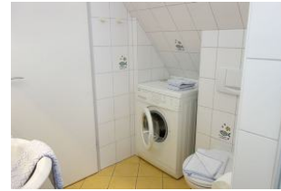
... und Waschmaschine