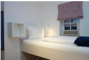
Das obere Bett