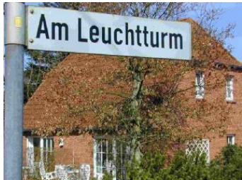
Das Haus Am Leuchtturm 1a

Die Unterkunft verteilt sich über EG und 1.OG.