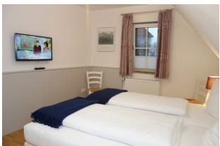
Das zweite TV Gerät im Schlafzimmer