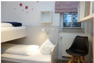
Ein Stuhl zum "am Bett sitzen und vorlesen" ....