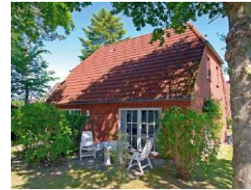
Die Terrasse, schön eingewachsen !