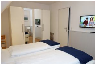
Großer Schrank für düt un dat....