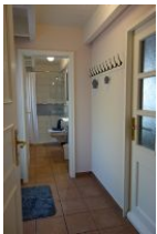
Der kleine Flur führt ins Bad. Rechts die Tür in die Garage, links die Tür auf die Terrasse