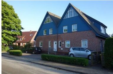
Das Haus Olhörnstieg 6, die Unterkunft befindet sich im Erdgeschoss links