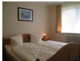
Großes Doppelbett im Elternschlafzimmer