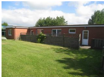
Das Grundstück der Familie Carstensen Im Bild: die Bungalows 1 und 2