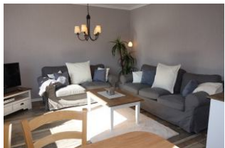
Zwei große, gemütliche Couchen laden zum "langmachen" ein.