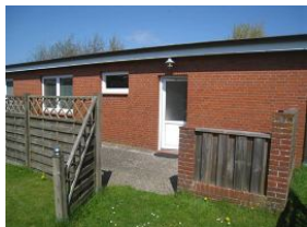
Die Eingangstür des Bungalow 2 Vorn links befindet sich "Ihre" Terrasse

Auf einem ca. 3000qm großen Grundstück zwischen Boldixumer Str. und Umgehungsstr. können wir Ihnen 4 Ferienwohnungen bieten. Die Wohnung 2 - ein Reihenbungalow von ca. 50qm bietet 4 Personen Platz. Ideal für Gäste, die inmitten der Stadt wohnen wollen. Von hier aus können Sie alles zu Fuß erledigen, auch Ihr Auto darf sich ausruhen. Der Bungalow ist funktionell eingerichtet. Auf dem Grundstück befindet sich ein großer Spielplatz für die Kinder und auch der Parkplatz.