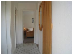
Der Flur, treten Sie ein....