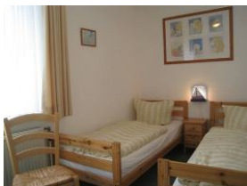
Das Kinderzimmer mit zwei Einzelbetten