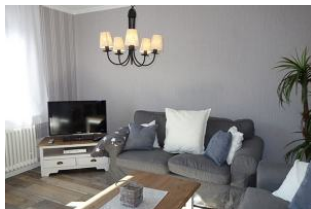
Moderne TV - Technik