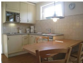
Die Einbauküche mit Essplatz