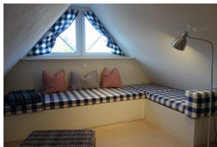
Das Lese-, Ausrub-, Musikhör-, Laß' mich in Ruhe - Zimmer im Dachgeschoß