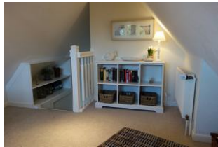
Lesestoff im Dachzimmer