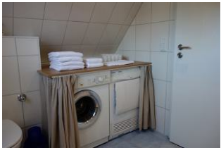
Waschmaschine + Trockner zur kostenfreien Nutzung