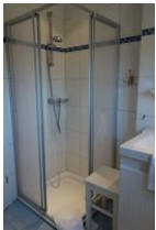
....Duschkabine... (Nicht im Bild die Toilette)