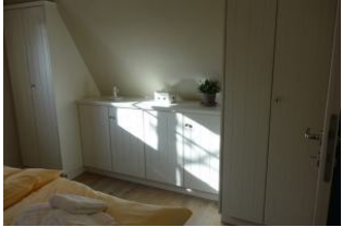
...genügend Schrank- und Stauraum.