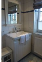
Das Badezimmer mit Waschtisch....