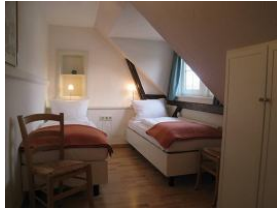
Ein Schlafzimmer mit zwei Einzelbetten, die problemlos auch zusammen geschoben werden können. (Hotelbetten)