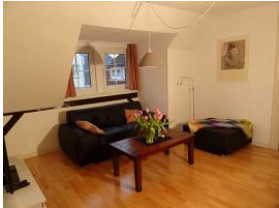
und noch einmal das Wohnzimmer.