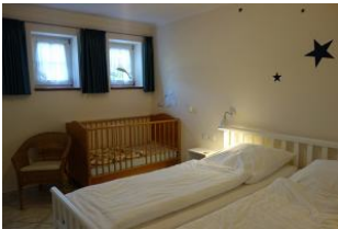
Großes Doppelbett und Holzbabybett...