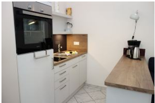
...hier noch einmal aus der Nähe.