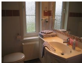
Bad im Erdgeschoß: Toilette, Waschbecken, großer Spiegel und ...