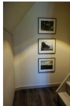
...hier finden Sie Schränke für Ihre Kofferinhalte und hier geht's hinauf ins Dach in die gemütliche Lesecke