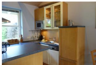
...Spülmaschine, Spülbecken, Kaffeemaschine, Wasserkocher, alles da.