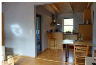
Der Blick in die Küche mit kleinem Tresen, dahinter verbirgt sich das Ceranfeld mit 4 Kochfeldern und der Backofen.