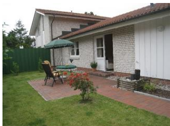
Haus Anna, Eingang + Terrasse mit.....