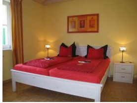
Das Schlafzimmer mit Doppelbett 180x200cm Nicht im Bild: Kleiderschrank + TV Gerät.

Die Terrasse ist gleichzeitig der Eingang zur Wohnung