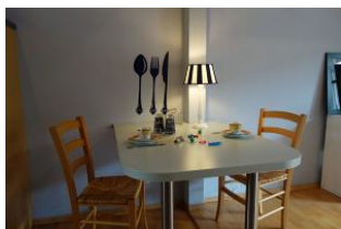
Der Essplatz vor der Küche