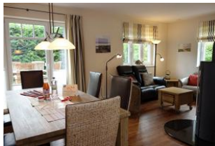
Der Blick vom Esstisch zur Sitzzecke