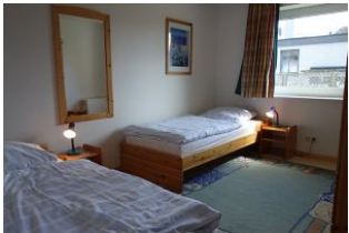
Großes Kinderzimmer mit 2 Einzelbetten