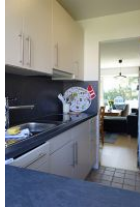
Die Küche mit Blick ins Wohnzimmer....