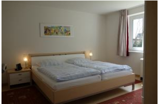
Das große Doppelbett im Schlafzimmer