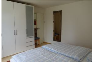
Der Schrank im Elternschlafzimmer.