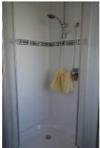
...Dusche. Nicht im Bild, das WC