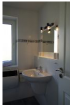
Das Badezimmer mit ....