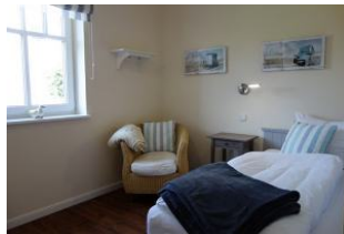
Ein Schlafzimmer im Erdgeschoß mit Einzelbett, Kleiderschrank. Nicht im Bild, das TV - Gerät.