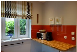
...und eine sep. Arbeitsfläche