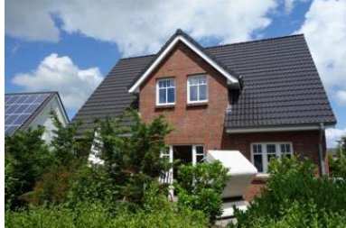
Das Haus Flurstrasse 28

Die Unterkunft verteilt sich über EG und 1.OG.