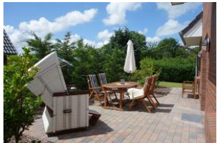
Die herrlich eingewachsene Terrasse. Die Terrassentür befindet sich am Essplatz.

Entfernungen, zirka: zum Bäcker 670 m, zur Einkaufsmöglichkeit 670 m, zum Flugplatz 3,7 km, zum Golfplatz 4,7 km, zum Hafen 1,4 km, zum Meer 800 m, zum ÖPNV 400 m, zum Badestrand 800 m, zum Ortszentrum 850 m