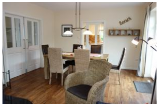
Der Blick von der Sitzecke zum Esstisch