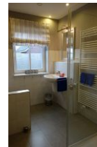
Das Duschbad im EG, hier befindet sich auch die Waschmaschine, die Ihnen kostenfrei zur Verfügung steht.