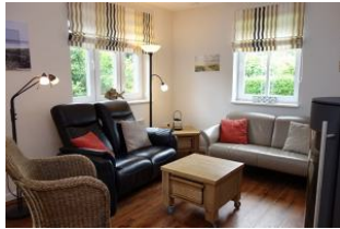
Der schwarze Zweisitzer ist besonders gemütlich, die Rückenlehnen sind verstellbar ....