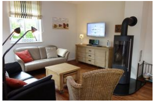
Zwei Sofas, ein Sessel - herrliche Runde für den perfekten TV - Abend