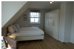
Viel Schrankraum .....