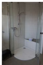
....großer Duschkabine und einer Sitzbank für Kinder