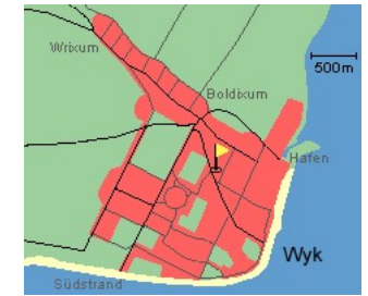
Entfernungen, zirka: zum Bäcker 670 m, zur Einkaufsmöglichkeit 670 m, zum Flugplatz 3,7 km, zum Golfplatz 4,7 km, zum Hafen 1,4 km, zum Meer 800 m, zum ÖPNV 400 m, zum Badestrand 800 m, zum Ortszentrum 850 m