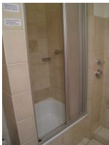
.. Dusche mit tiefer Wanne.