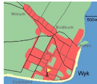
Entfernungen, zirka: zum Bäcker 20 m, zur Einkaufsmöglichkeit 200 m, zum Flugplatz 1,2 km, zum Golfplatz 1,4 km, zum Hafen 1,5 km, zum Meer 80 m, zum ÖPNV 300 m, zum Badstrand 80 m, zum Ortszentrum 1,2 km