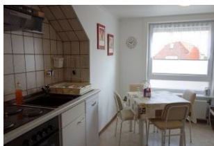
Die linke Seite der Küche, jetzt neu mit Geschirrspüler