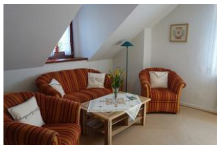
Im Wohnzimmer die gemütliche Couchgarnitur und zwei Sessel

Möchten Sie inmitten der Stadt wohnen ? Alles zu Fuß erreichen können ? Bitte schön. Wir bieten Ihnen diese gemütliche Wohnung für 4 Personen im 1.OG des Hauses Deterding an. Wohnzimmer, Küche mit Eßplatz, 2 Schlafzimmer, neues Duschbad. Keine Teppichböden. In dem hauseigenen Garten wartet ein Terrassenplatz auf Sie. Nach der Fahrradtour, nach dem Strandtag, wann auch immer - Ihr Gartenplatz ist für Sie reserviert.