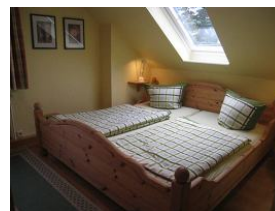
Das große Elternbett im Schlafzimmer