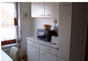
Die andere Seite der Küche