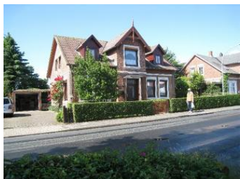
Das Haus Boldixumer Str. 25 in Wyk