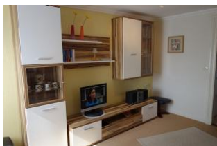
...hier noch einmal von der anderen Seite.