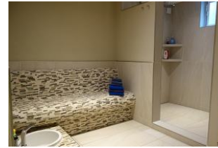
...Sitzbank, rechts der Duschaum, links ein Fussbecken