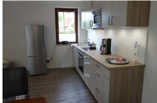
...und in den Kühlschrank passt eine Menge hinein, im unteren Teil befindet sich ein Gefrierschrank.