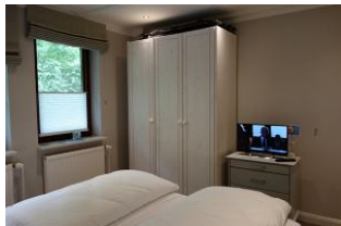
...auch hier ein kleines TV - Gerät. Großer Kleiderschrank.