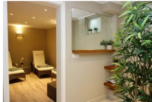
Blick in den Ruheraum