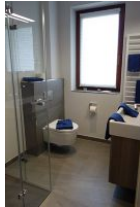
Das Duschbad - ganz modern.....