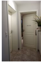
Im Keller des Hauses befindet sich der Saunabereich