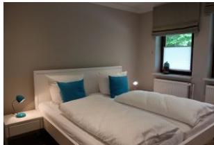
Das große Doppelbett 180x200cm im Schlafzimmer...