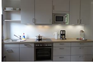
Die Küchenzeile, hell + freundlich mit viel Platz !