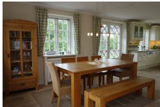
Der Essplatz, im Hintergrund die Küche