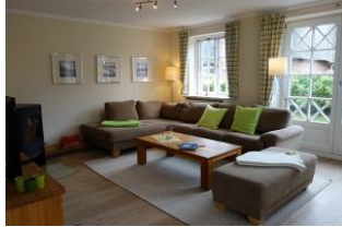
Genügend Platz für Alle ....