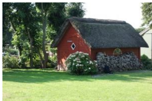
Im Schuppen dürfen Sie gern Ihre Räder unter stellen.