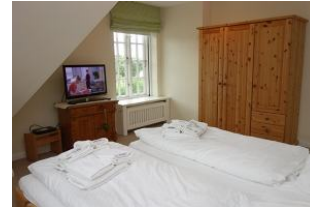
...mit TV Gerät