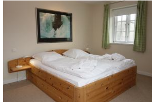
Das Doppelschlafzimmer im OG...