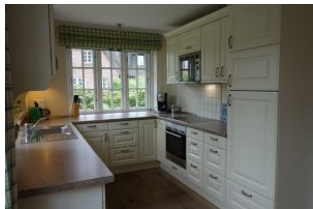
Die Küche von der einen...