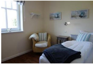
Ein Schlafzimmer im Erdgeschoß mit Einzelbett, Kleiderschrank. Nicht im Bild, das TV - Gerät.