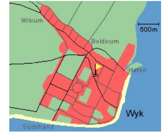
Entfernungen, zirka: zum Bäcker 670 m, zur Einkaufsmöglichkeit 670 m, zum Flugplatz 3,7 km, zum Golfplatz 4,7 km, zum Hafen 1,4 km, zum Meer 800 m, zum ÖPNV 400 m, zum Badestrand 800 m, zum Ortszentrum 850 m