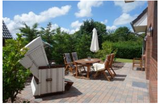
Die herrlich eingewachsene Terrasse. Die Terrassentür befindet sich am Essplatz.