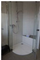
....großer Duschkabine und einer Sitzbank für Kinder