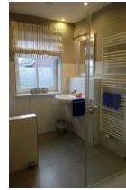
Das Duschbad im EG, hier befindet sich auch die Waschmaschine, die Ihnen kostenfrei zur Verfügung steht.