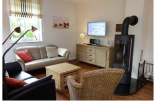
Zwei Sofas, ein Sessel - herrliche Runde für den perfekten TV - Abend