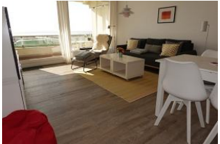
Das Wohnzimmer im Gänze