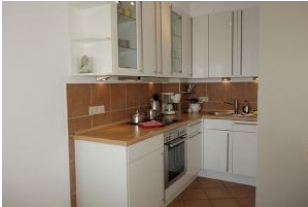
Die offene Küche beinhaltet alles, "was man so braucht"