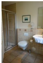
Das Bad im EG