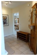
Der Flur im Eingangsbereich