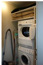
Waschmaschine und Trockner, Bügelbrett und Bügeleisen.