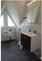
Der Waschtisch im modern gestalteten Bad...