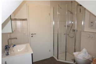
..Dusche mit Echtglaskabine, flacher Einstieg.