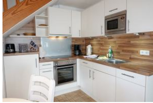
Die offene Küche mit Backofen, Mikrowelle, Geschirrspüler, Ceranfeld....