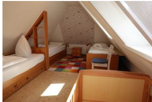
Das Kinderschlafzimmer mit 3 Betten, zus. ein Babybett aus Holz