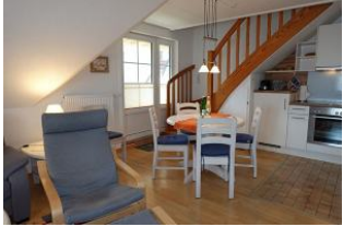
Der Blick zur Küche.