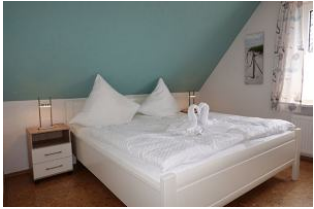
Das Elternschlafzimmer Bettmaß 180x200cm