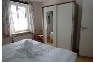
... der Schrank für die Kofferinhalte