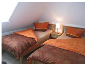
Das Schlafzimmer mit zwei Einzelbetten, und ....