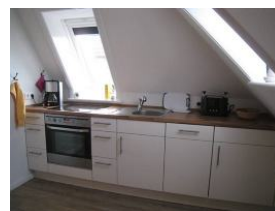
...die offene Küchenzeile hat "alles, was man so braucht!"