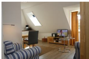
Ein erster Blick in das Wohnzimmer...

Zauberhafte, helle Wohnung im 1.OG eines Zwei-Familienhauses. Im Juni 2011 komplett renoviert und mit viel Liebe zum Detail eingerichtet. Das Wohnzimmer mit offener Küchenzeile (sehr kommunikativ!), das Schlafzimmer mit zwei Einzelbetten, großem Einbauschränk und nicht zuletzt das neue Bad mit flacher Duschwanne für den bequemen Einstieg. Zudem wartet im Garten ein herrliches Plätzchen auf Sie....Lassen Sie es sich gut gehen und genießen Sie die Atmosphäre.