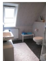
Das geräumige Bad mit ...