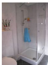
... herrlich großer Duschkabine