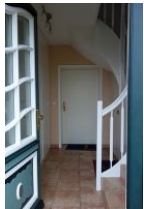
Der Eingang zur Wohnung 3

Das Hus Dikstian in Alkersum mit 5 Wohneinheiten bietet jedem etwas. Hier können Sie mit Ihren Freunden wohnen. Alle zusammen und doch hat jeder sein eigenes Reich.... Die Wohnung 3 verfügt über 2 Schlafzimmer mit 4 normalgroßen Betten. Der große Wohnraum mit Couch "zum langmachen", Lesesessel, großem Esstisch und Zugang zur Küche sollte der Familienmittelpunkt sein. Ein großzügiges Badezimmer mit Badewanne, Glaswand zum Duschen, sorgen zusätzlich für Wohlfühlambiente. Das Haus steht auf einem großen Grundstück, welches alle Gäste benutzen dürfen, jede Wohnung hat jedoch für sich eine Terrasse. Parkplatz auf dem Grundstück.