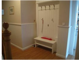
Die Garderobe mit Sitzbank und Schuhregal im Flur - nur für Sie.