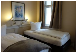
Zwei Einzelbetten im Schlafzimmer, das Fenster führt zur Loggia