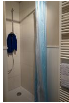
... geräumiger Dusche (flacher Einstieg).