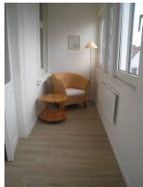
Ein gemütlicher Leseplatz auf der anderen Seite der Loggia