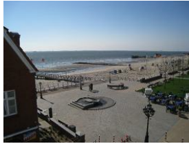
...herrlich, die Mittelbrücke und der Gezeitenbrunnen