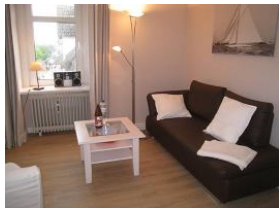
Die neue Couch zum "langmachen" und ...