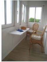
Auf der Loggia können Sie beim Frühstück den Blick auf das Meer genießen.