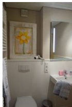
Das neu gestaltete Bad mit viel Ablagefläche und ....