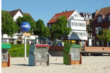
Das Haus Mittelstr.2/Ecke Sandwall