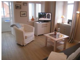
Das Flachbild - TV - Gerät + DVD Player