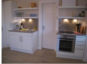
Die moderne Küchenzeile...