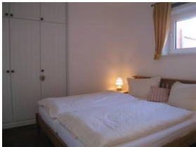
Das Schlafzimmer mit großem Doppelbett