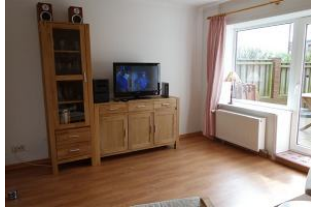
Grosses Fenster und Tür zur Terrasse