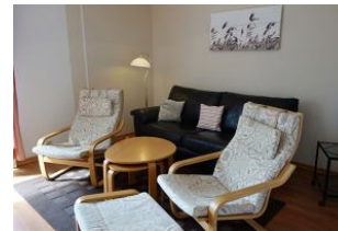
Das Wohnzimmer mit Couch und gemütlichen Sesseln.