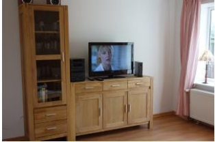
Die Technik darf natürlich auch nicht fehlen....