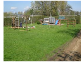
Der Spielplatz auf dem Grundstück, dahinter befindet sich der Parkplatz.