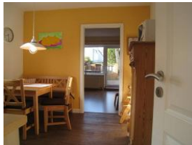
Ein Blick in die Küche mit Essplatz. Im Hintergrund das Wohnzimmer.