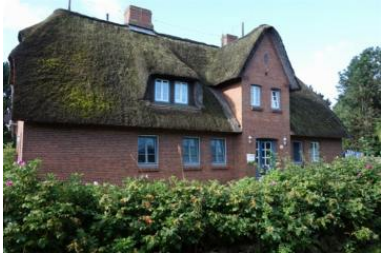
Das Haus Bredland 2a Die Whg.4 befindet sich im 1.OG links