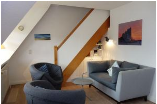
Gemütliche Sitzecke mit kleiner Couch und zwei Sesseln

Komfortable, in warmen Farben eingerichtete OG-Wohnung für 2-4 Personen. Auf halbem Weg zwischen Wyk und Nieblum steht dieses Reetdachhaus mit 4 Wohneinheiten. Wer die Ruhe sucht, den weiten Blick über Pferdekoppeln liebt, wohnt hier genau richtig. Das Meer ist so nah, man kann es fast riechen. Ideal auch für Golfer, denn der Golfplatz ist zu Fuß erreichbar.