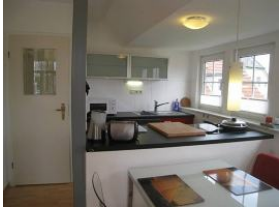
Die offene Küche...