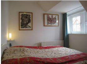
Das Elternschlafzimmer mit großem Doppelbett 180x200cm und ...