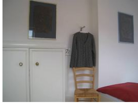
Der Schrank bietet genügend Stauraum