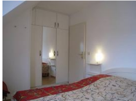
... großem Einbauschränk.