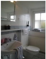
Das Badezimmer mit Waschbecken und Toilette....