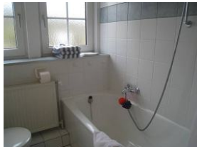
... sowie Badewanne mit Duschmöglichkeit.