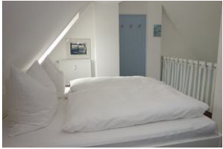
...eine Garderobe zum Kleiderlüften, und.....