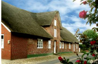
Das Haus "Welkimen tūs" in Oldsum Eingang zur Wohnung "Tradition"