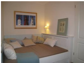
Im Kinderzimmer ein kuscheliges Einbaubett. Achtung: das Bett verfügt über eine Größe von 180x178cm...