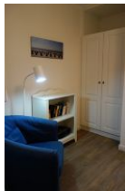
...kleiner Rückzugsort - der Lesesessel im Kinderzimmer