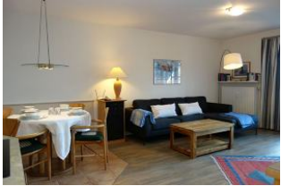
...der Esstisch und der Blick zur Couch