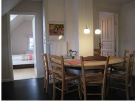
Im 1.OG die herrliche Essstiege...