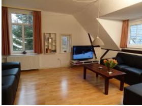
Ein großzügiger Wohnraum für Alle