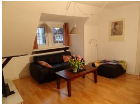
und noch einmal das Wohnzimmer.