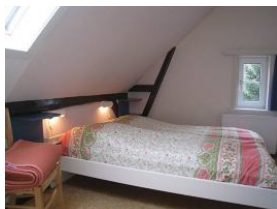
Ein zweites Schlafzimmer mit Doppelbett 160x200cm ...