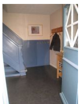
Der Flur und Eingangsbereich der Whg. 1 - Picasso

Das Malerhaus wurde lange Zeit durch die Familie Böhmig vermietet, die auch für das Gästehaus Rothtraut verantwortlich zeichnete. Wir freuen uns sehr, Ihnen jetzt drei renovierte Wohnungen anbieten zu können. Die Wohnung Picasso bietet ausreichend Platz für 6 Personen. Im EG, gleich im Eingangsbereich befindet sich ein aussergewöhnliches Duschbad. Waschtisch, Toilette und der Clou: in der großen, gemauerten Duschkabine gibt es zwei Handbrausen, es können also leicht zwei Personen gleichzeitig duschen. Ideal nach einem Strandtag.... Im OG befindet sich eine Essdiele mit offener Küchenzeile - sehr kommunikativ - von der aus drei Schlafzimmer und ein Badezimmer mit zwei Waschtischen und sep. Toilette zu erreichen sind. Eine ungewöhnliche Wohnung mit viel Charme.