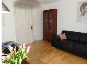
... eine zweite Couch..