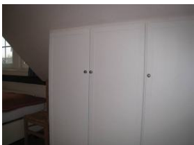
Der Schrank bietet genügend Stauraum.