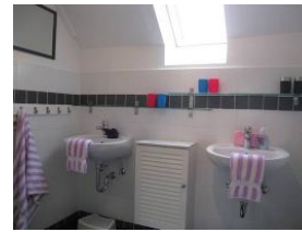
Badezimmer mit zwei Handwaschbecken und ...

.... sep. Toilette (in diesem Bad gibt es keine Dusche/Wanne)