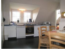
... mit offener Küchenzeile