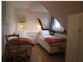
Ein Schlafzimmer mit zwei Einzelbetten, die problemlos auch zusammen geschoben werden können. (Hotelbetten)