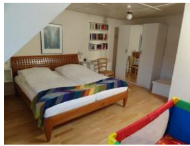
Das dritte Schlafzimmer mit großem Doppelbett 180x200cm Hier würde auch noch ein Kinderbett hinein passen

.... sep. Toilette (in diesem Bad gibt es keine Dusche/Wanne)