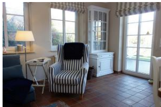
...und ein Ohrensessel.