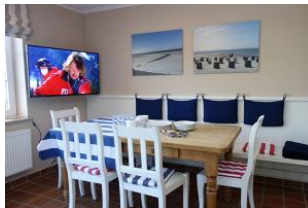
...sieht aus, als gäbe es gleich etwas zu essen.....