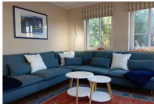
Die große, gemütliche Couchecke, Platz für alle....