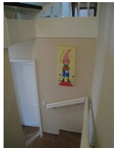
Der Glückswichtel des Hauses