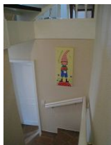
Der Glückswichtel des Hauses