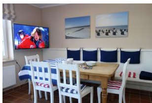
...sieht aus, als gäbe es gleich etwas zu essen.....