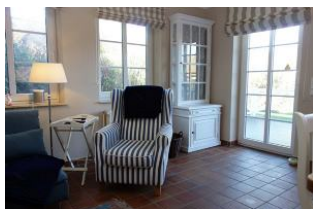
...und ein Ohrensessel.