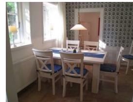
Frühstück mit Sonne - herrlich