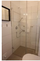
...bodengleicher Dusche und...

Entfernungen, zirka: zum Bäcker 300 m, zur Einkaufsmöglichkeit 800 m, zum Flugplatz 2,9 km, zum Golfplatz 3,0 km, zum Hafen 800 m, zum Meer 200 m, zum ÖPNV 400 m, zum Badestrand 200 m, zum Ortszentrum 800 m