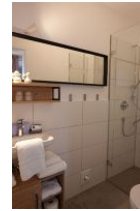
...großem Spiegel. Nicht im Bild die Toilette