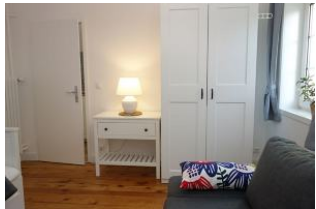
...und Platz für Kofferinhalte