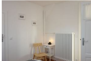
...direkter Zugang zum Bad.