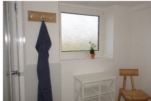
...großem Fenster ..