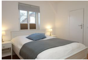
Das Elternschlafzimmer mit großem Doppelbett 160x200cm