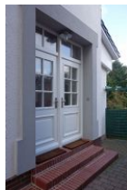
Die Haustüren der Villa Hansson, jede Wohnung verfügt über einen eigenen Eingang.