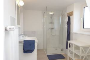
Das Bad mit flacher Duschwanne..