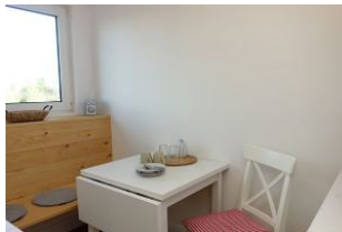
...und einem kleinen Tisch zum Essen. Klein aber oho !