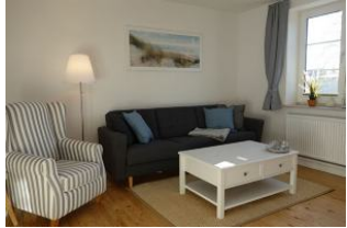
...mit großer Couch zum "langmachen" und gemütlichem Sessel...