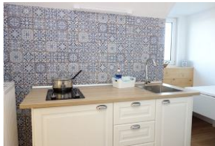
Die sep. Küche mit kleiner Zeile...