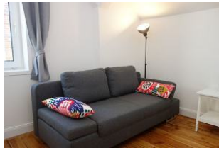
...und zus. Schlafcouch.