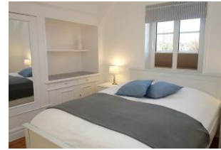
...die alten Einbauten wurden erhalten.