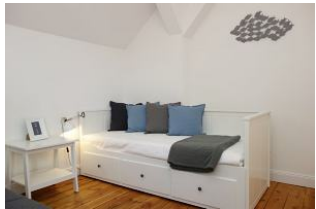
Das Kinderzimmer mit einem Einzelbett...

Entfernungen, zirka: zum Bäcker 50 m, zur Einkaufsmöglichkeit 50 m, zum Flugplatz 3,0 km, zum Golfplatz 3,2 km, zum Hafen 500 m, zum ÖPNV 70 m, zum Badestrand 350 m, zum Ortszentrum 100 m