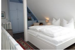
Das Doppelbett 180x200cm auf der Galerie, sowie...