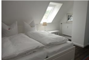
...ein Fenster um die frische Luft herein zu lassen.