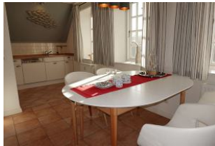
...hier noch einmal der Esstisch.