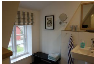
Das Bad im OG mit Handwaschbecken....